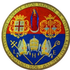
Fig. 4 Stemma dell’Ateneo cagliaritano 39

“Nel mezzo l’immagine della Madonna, ai suoi piedi la tiara da Pontefice con la lettera H, che significa il nome di Sant (H)ilario papa. In basso due mitre da prelado: di cui quella a destra con la lettera L, che significa il nome di San Lucifero con la croce primaziale; e l’altra la lettera E, che significa il nome di Sant’Eusebio con la sua insegna pastorale. Ad un lato della Vergine l’insegna della città di Cagliari e all’altro lato l’insegna del Regno (di Sardegna, con i 4 mori) 38