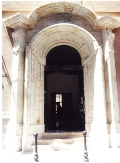
Fig. 3 Ingresso del Palazzo Tridentino 37